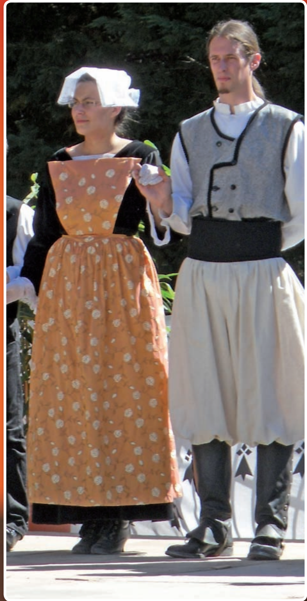
Costume porté vers 1850