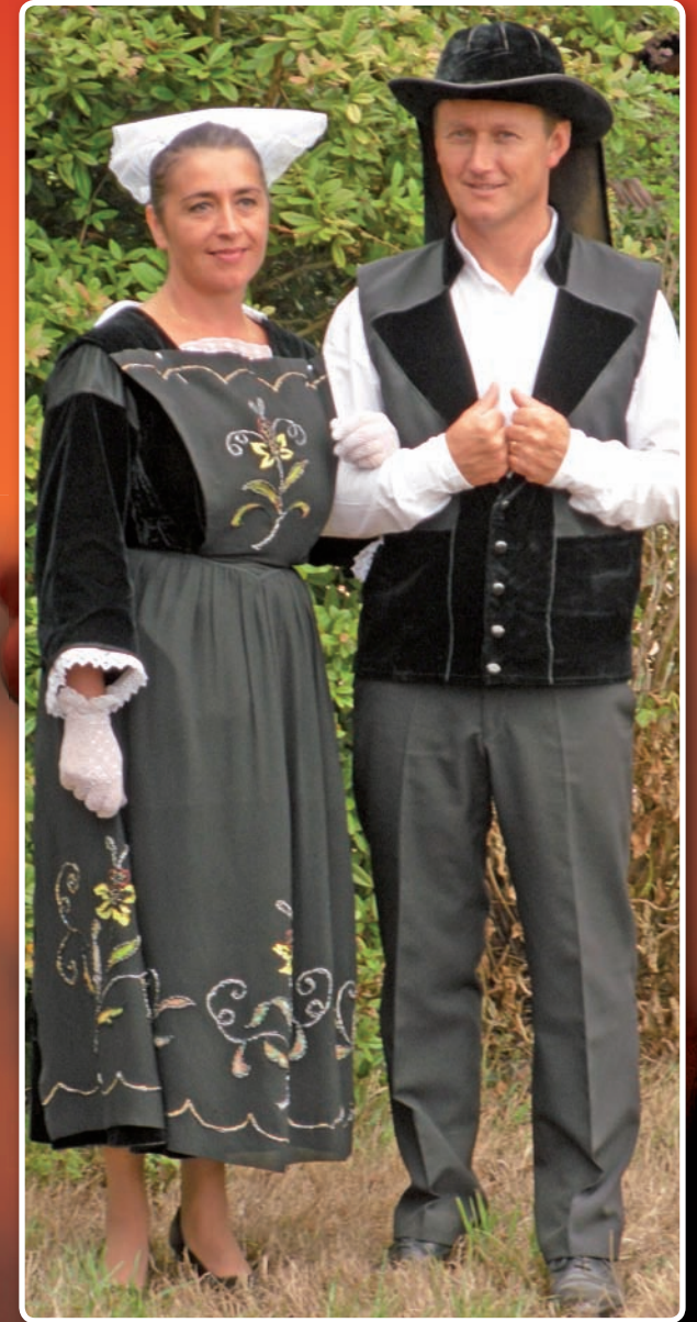
Costume porté vers 1920