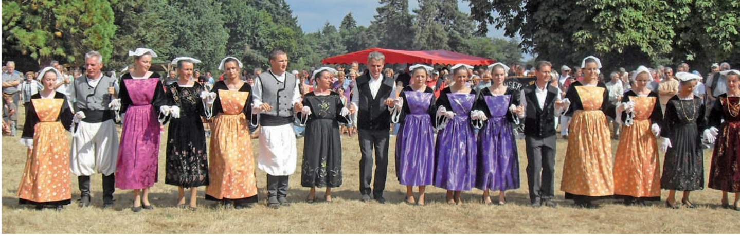
St Martin sur Oust